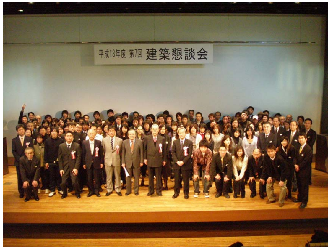
■第7回建築懇談会集合写真・・・・・・・・平成19年1月13日(土)