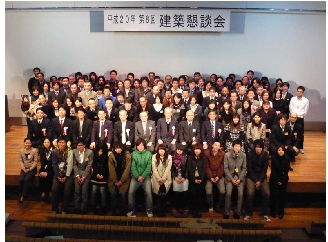
■第8回建築懇談会集合写真・・・・・・・・平成20年1月12日(土)