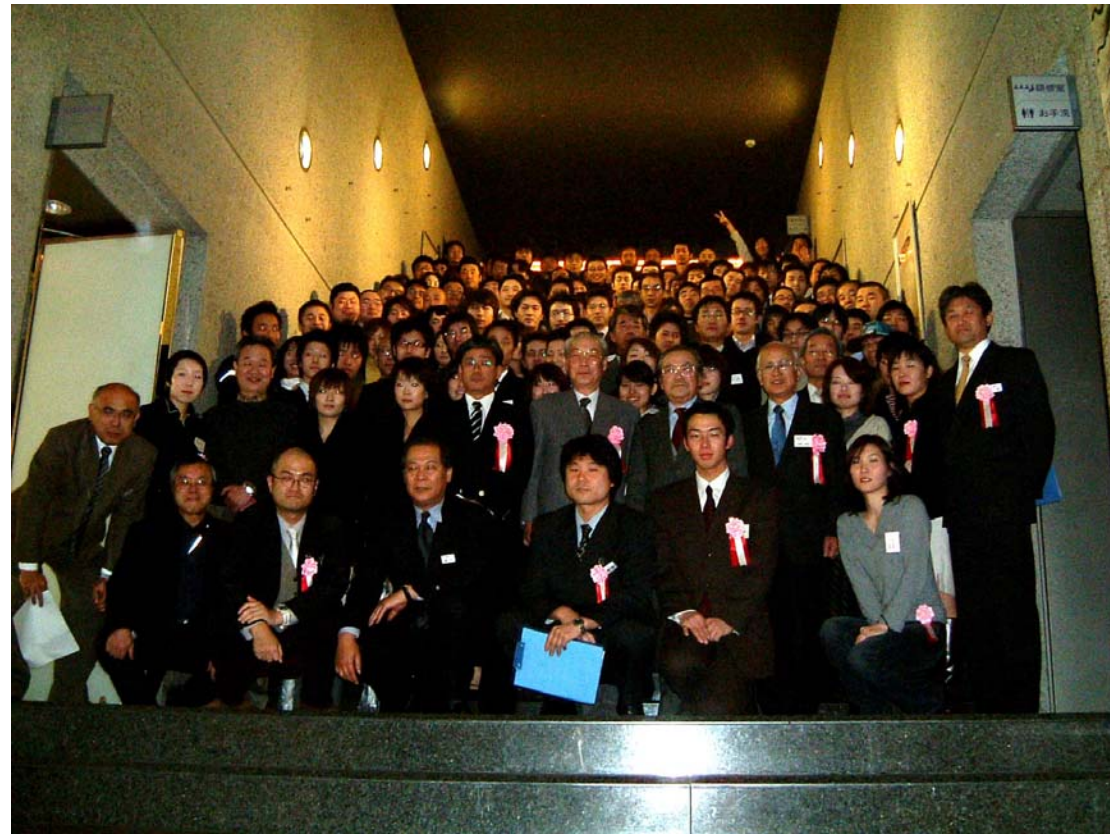
■第6回建築懇談会集合写真・・・・・・・・平成18年1月14日(土)