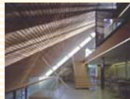
RISE 創立 100 周年記念館