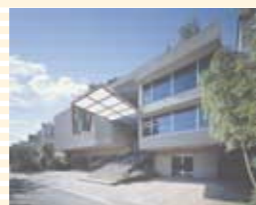
STEP 創立 85 周年記念館

〒561-0872 大阪府豊中市寺内 1-1-43 TEL: 06-6866-0800 http://www.chuoko-osaka.ac.jp/